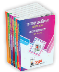
থ্রিটেড প্রশ্নব্যাংক ৬টি