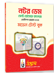
মডেল টেস্ট বুক ১টি